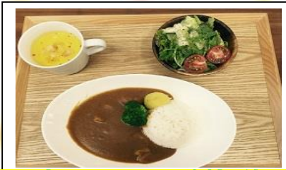
地元生まれのおいしい食材を使ったお料理をお楽しみください😊