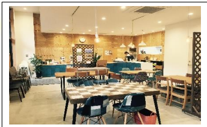
各種イベント向けにリーススペースレンタルも 行っています